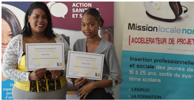
2 jeunes recevant leur attestation de JAR le 11/04/2018

A ce jour, 50% des jeunes sont en attente de démarrer leur formation CQP dans l'animation pour finaliser le parcours d'insertion.